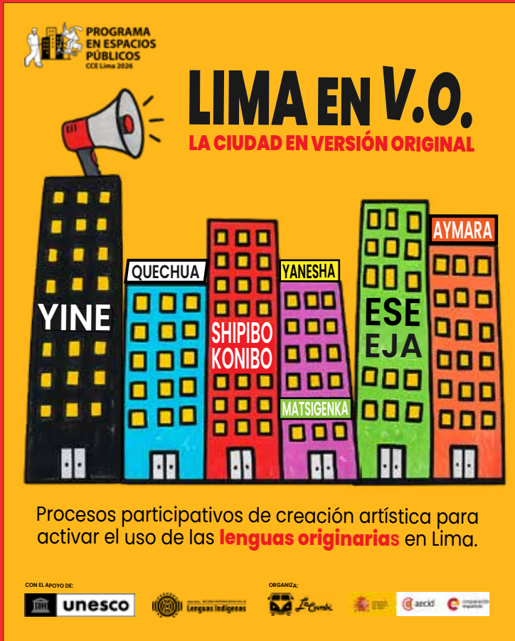
Imagen de portada: Programa en Espacios Públicos 2026: proyecto Lima en Versión Original.