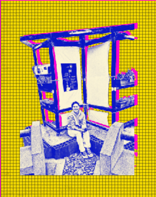
Imagen de portada: Programa en Espacios Públicos CCE Lima: Latente. Tiempo, Cuerpo y Espacio

www.ccelima.aecid.es info.ccelima@aecid.es f i y t @CCELima (511) 330 04 12