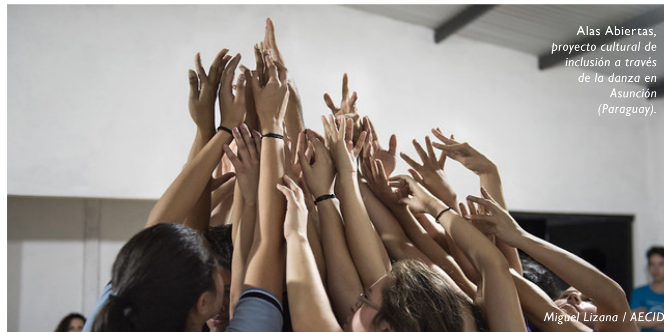
Alas Abiertas, proyecto cultural de inclusión a través de la danza en Asunción (Paraguay).