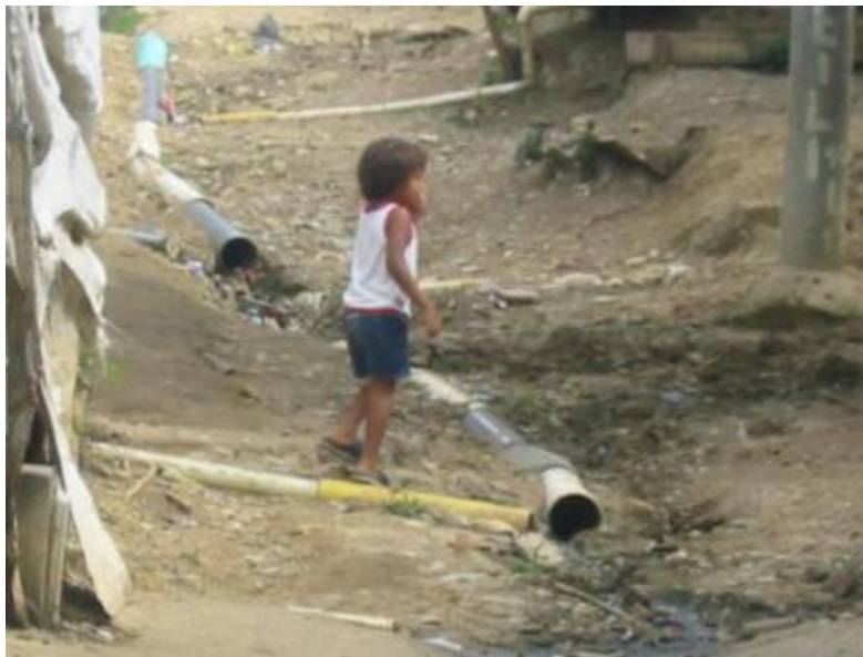
Fotografía No 2: Población Infantil en contacto con las aguas residuales