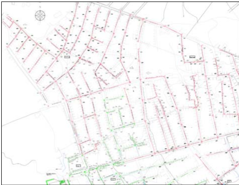
Esquema Redes de Alcantarillado Barrio Nelson Mandela

Además de los colectores, se debe hacer la instalación de 433 cámaras de alcantarillado y 6.191 registros domiciliarios para la evacuación de cada una de las viviendas.