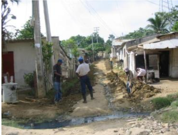
Fotografía No 1: Aguas residuales corriendo por las calles