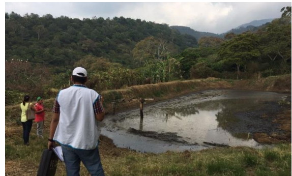
Fotografía 6: levantamiento de demandas para sector: turismo, industria y agroindustria