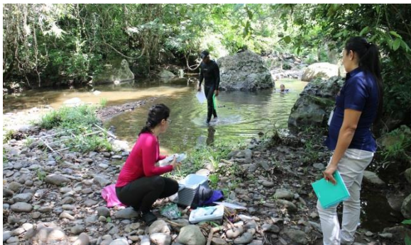
Fotografía 5: Definición de medición de indicadores biológicos para determinación de caudales ecológicos