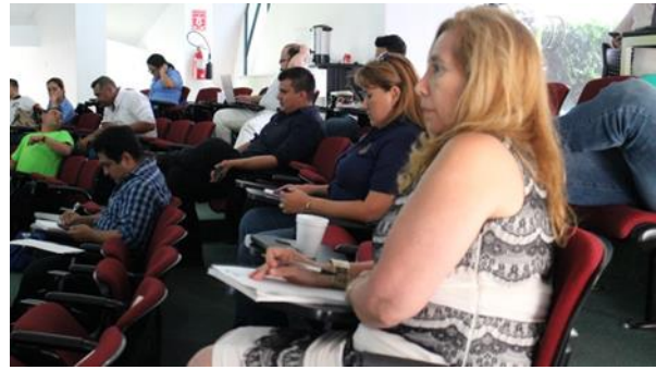
Fotografía 2: Jornadas de Capacitación y Formación - IMTA