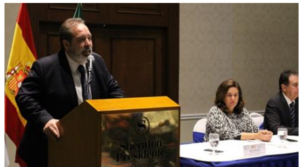
Fotografía 4: Cierre del proceso de capacitación y formación - IMTA