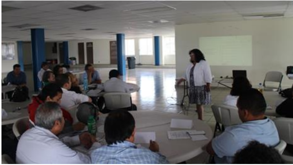
Fotografía 1: Jornadas de Capacitación y Formación - IMTA