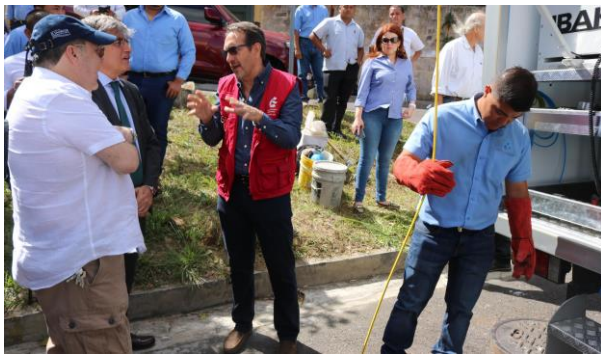
Fotografía 3: Equipos para catastro de redes