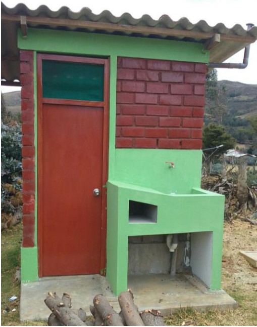
Fotografía 1: Unidad Básica de Saneamiento mejorada, Las Pircas