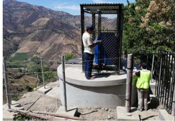
Fotografía 2: Reservorio y sistema de cloración del sistema de abastecimiento de agua potable de la Localidad de Canales-Sapillica