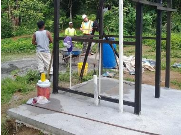
Fotografía 3: Unidad básica sanitaria en construcción en Peña Prieta (LPN-04). Junio 2019.