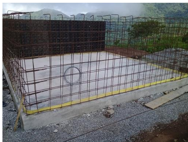
Fotografía 2: Tanque de Alto Maraca (LPN-04) en construcción. Junio 2019.