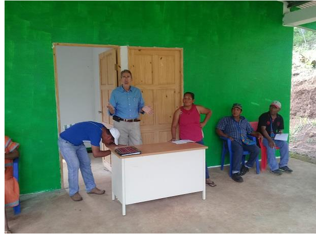
Fotografía 4: Reunión del Coordinador General con Directivas JAAR Chichica y Las Lajitas (LPN-02). Septiembre 2019.