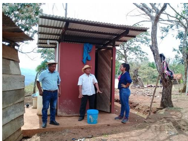
Fotografía 1: Unidad de Saneamiento Básico en Chichica (LPN-02). Abril 2019.