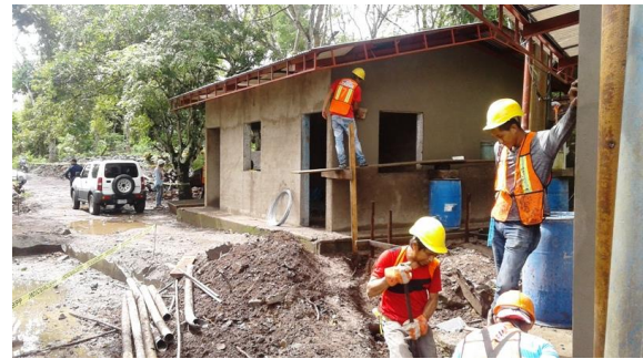
Fotografía 2: Rehabilitación caseta maquinas