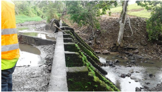
Fotografía 1: Vaciado presa Quipor previo a su restauración