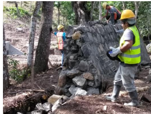
Fotografía 4: Reconstrucción dique con mampostería ciclópea