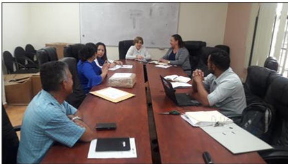
Fotografía 3: Recepción y Apertura de Ofertas para Proceso de Consultoría HND-017-B/001-2019