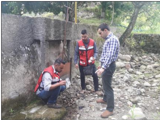
Fotografía 1: Visita a la Fuente La Hondura. Para la toma de muestras de agua cruda en el afluente de la presa para la campaña de analíticas de metales pesados