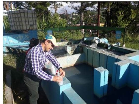
Fotografía 2: Visita a la PTAP Dolores, para la toma de muestras de agua cruda y potabilizada para la medición de metales pesados