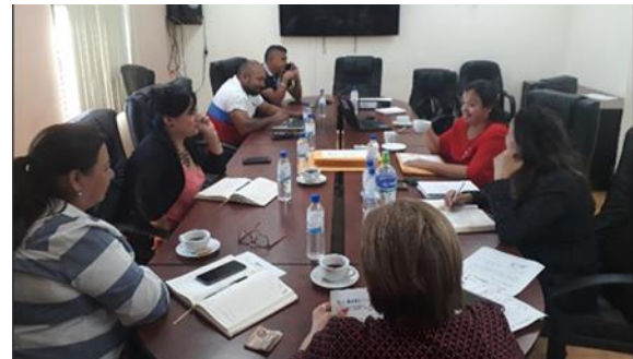
Fotografía 4: Recepción y Apertura de Ofertas para Proceso de Consultoría HND-017-B/002-2019