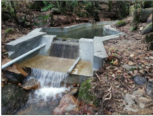
Fotografía 1: Obras de "Construcción del Sistema de Agua de Aguanqueterique Centro" (2019).