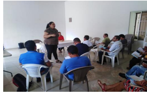
Fotografía 4: Talleres de tarifa a los prestadores de servicios en el marco del convenio de ASOMAICUPACO (2019).