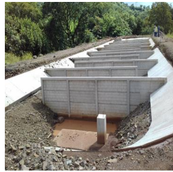
Fotografía 2: Obras "Construcción del Alcantarillado y PTAR Casco Urbano Lauterique" (2019).