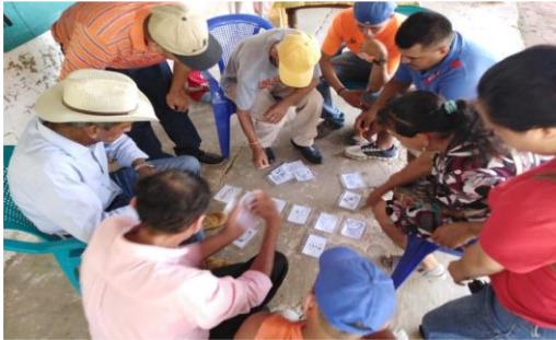
Fotografía 3: Fortalecimiento a las comunidades en saneamiento en el marco del convenio de ASOMAINCUPACO (2019).