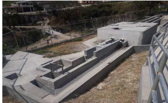
Fotografía 2: Imagen del Pretratamiento Sur finalizado (2019).