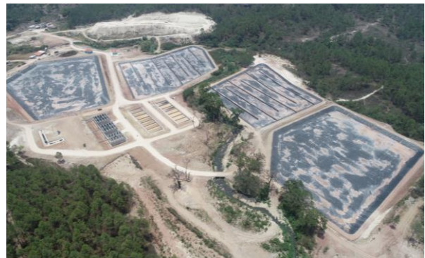
Fotografía 4: Vista aérea de las obras de la Planta de Tratamiento de Aguas Residuales (2019).