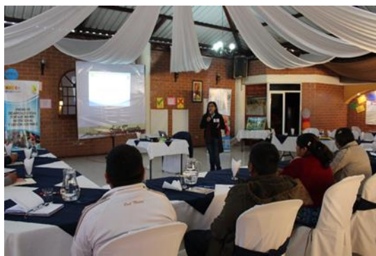
Fotografía 3: Fortalecimiento de capacidades a integrantes de los departamentos de agua potable y saneamiento para uso de materiales de sensibilización.