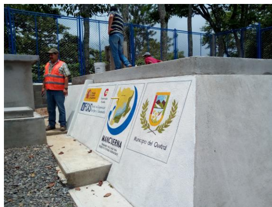
Fotografía 2: Certificación sistema de Agua Potable, Aldea el Paraíso, Municipio del Quetzal, San Marcos.