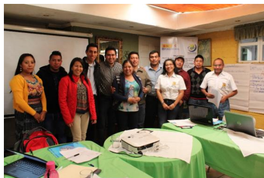
Fotografía 4: Capacitación a actores claves del programa FCAS MANCUERNA en la implementación del software sobre sistemas de seguimiento municipal.