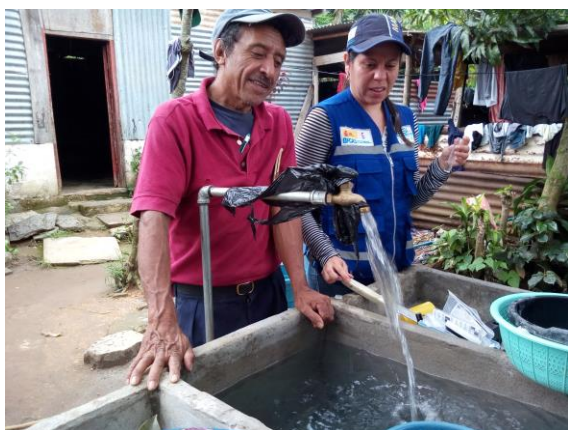
Fotografía 1: Certificación sistema de Agua Potable, Aldea el Paraíso, Municipio del Quetzal, San Marcos.