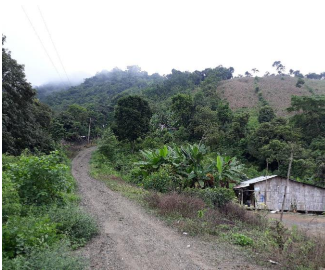
Zona de actuación