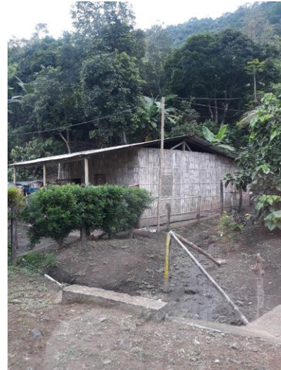
Zona de actuación