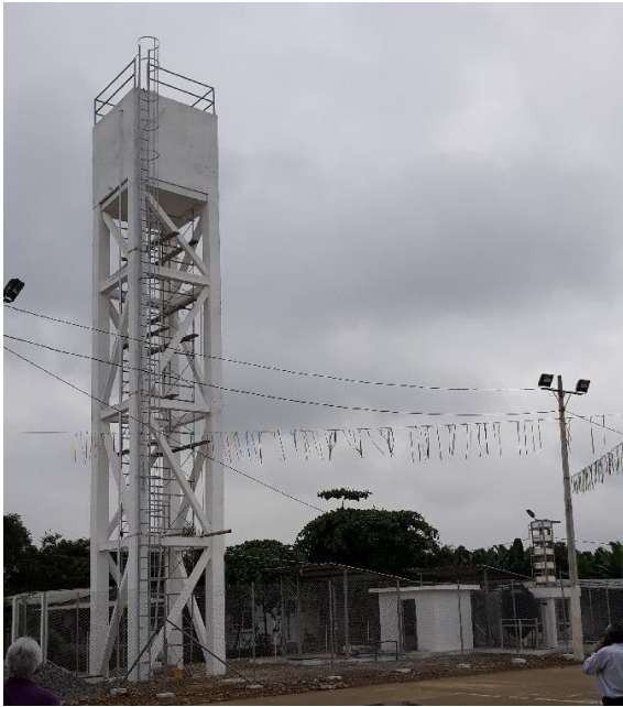
Fotografía 1: Tanque elevado Agua Potable, Comunidad La Palestina Municipio de El Guabo (Prov. El Oro)