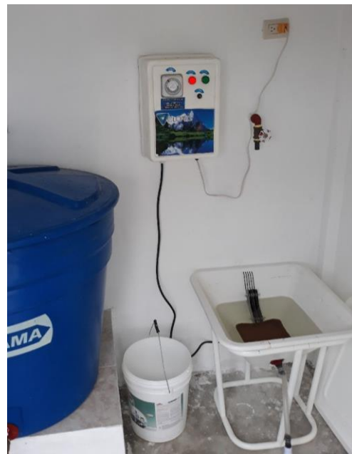
Fotografía 2: Sistema de cloración de la planta tratamiento Comunidad La Palestina Municipio de El Guabo (Prov. El Oro)