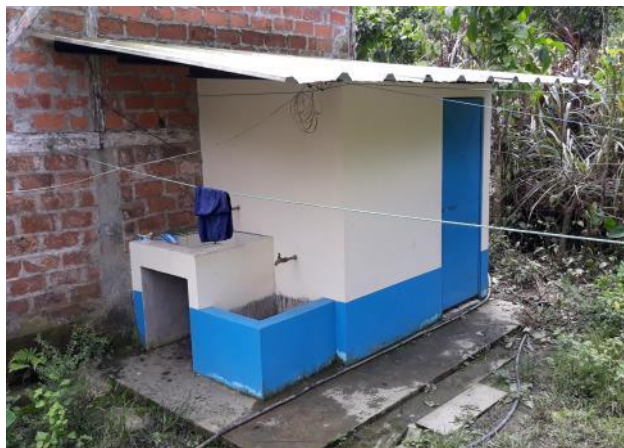
Fotografía 3: Unidad básica en el municipio de Balsas (Prov. Los Ríos).