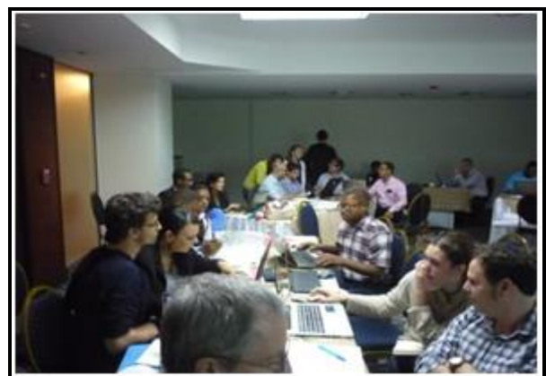
Taller Condominial: Trabajo en grupos