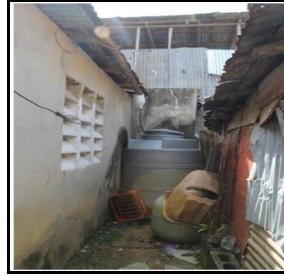
Sistema actual de abastecimiento de agua por lluvia - Cancino Adentro, SDE - 11-2015