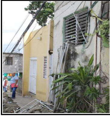
Sistema actual de abastecimiento de agua por pozo de agua subterránea privado - Cancino Adentro, SDE - 11-2015