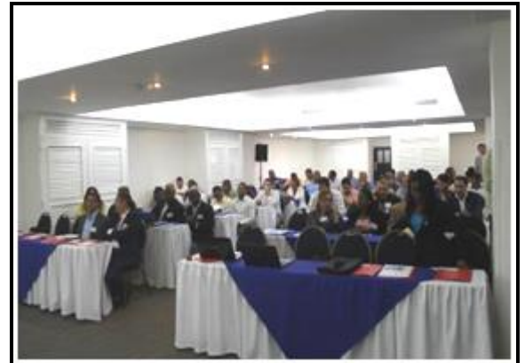
Taller Condominial: Primer día de trabajo con expertos brasileños