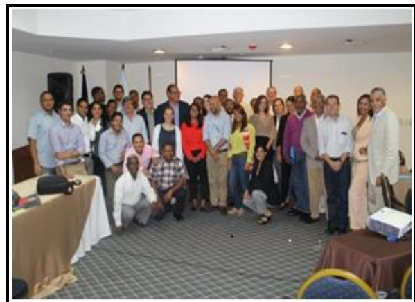
Taller Condominial: Cierre 20 de noviembre del 2015