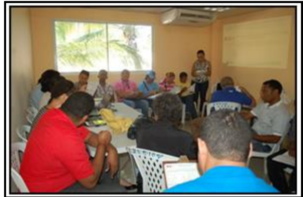
Fotografías 5 y 6: Imágenes de las Jornadas de Capacitación para las Encuestas Socioeconómicas