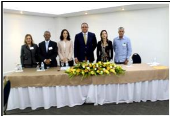
Taller Condominial: Inauguración 17 de noviembre del 2015