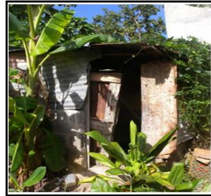
Letrina comunitaria - Cancino Adentro, SDE - 11-2015