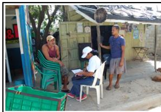
Fotografías 1 y 2: Aplicación de Encuestas