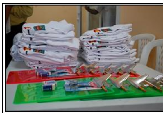
Fotografías 3 y 4: Dotación Uniformes y Herramientas de Trabajo Equipo de Campo