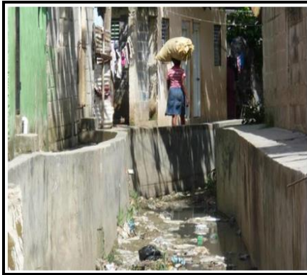
Descarga de agua pluvial y residual a cañada - Cancino Adentro, SDE - 11-2015