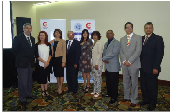
Fotografía 2: Primer Taller de socialización de la Estrategia Nacional de Saneamiento, 19 de marzo del 2015