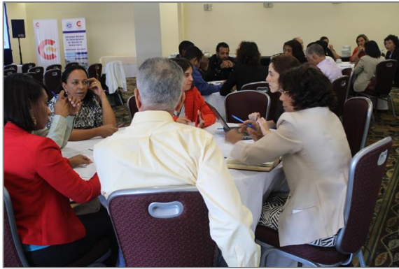
Fotografía 1: Mesas de Trabajo del Primer Taller de socialización de la Estrategia Nacional de Saneamiento, 19 de marzo del 2015