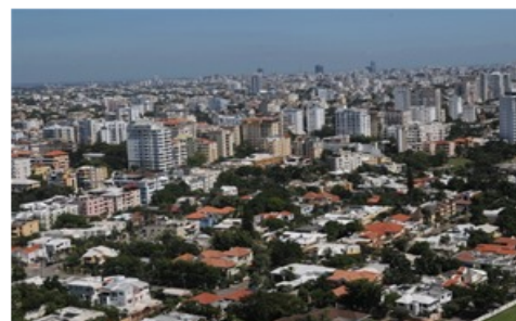
Precariedad. Durante un taller analizaron el problema de las aguas residuales en el Gran Santo Domingo.

Dijo que el problema de las aguas residuales y del alcantarillado sanitario en el Gran Santo Domingo es por falta de conciencia, de repuesta técnica, falta de voluntad política y de un marco jurídico.