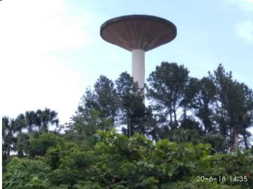
Tanque Hongo La Palma