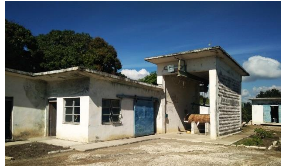
PTAP Ramón 2