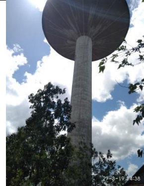
Tanque Hongo La Palma