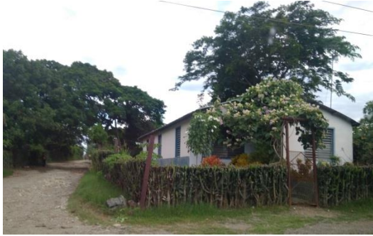
Poblado de Marcané