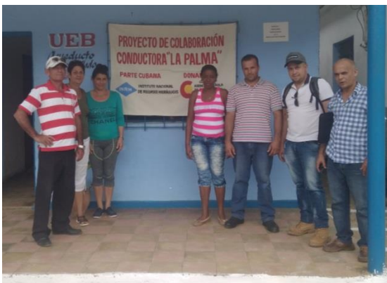
UEB Acueducto y Alcantarillado La Palma