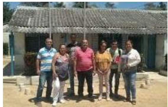
UEB Acueducto y Alcantarillado Cueto