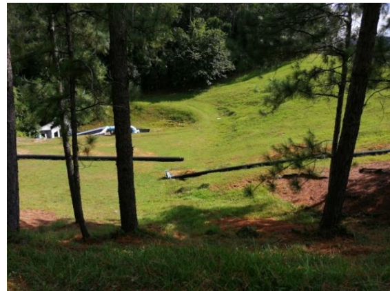
Fotografía 12: Conexión pendiente toma La Palma