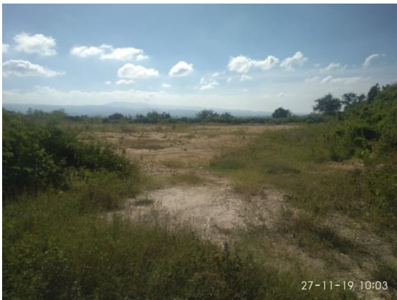
Fotografía 7: Plataforma PTAP Cueto