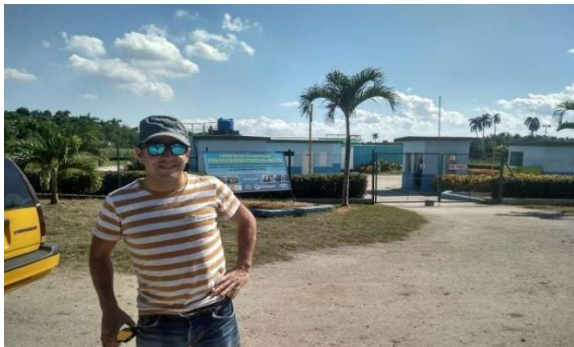
Fotografía 5: PTAP Báguanos