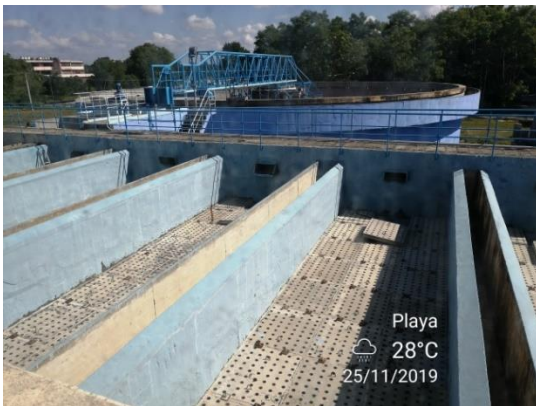
Fotografía 11: Filtros de Arena y Decantador PTAP Jatibonico