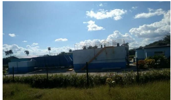
Fotografía 6: PTAP Báguanos