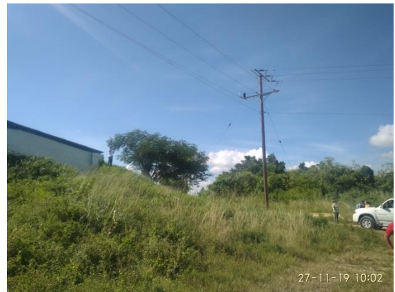
Fotografía 8: Deposito Cueto con línea eléctrica