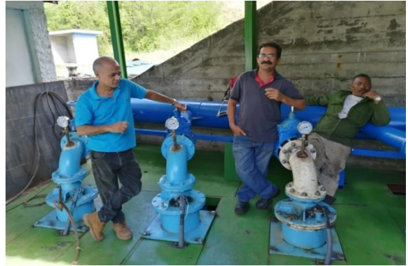
Fotografía 4: Estación bombeo toma embalse Guisa