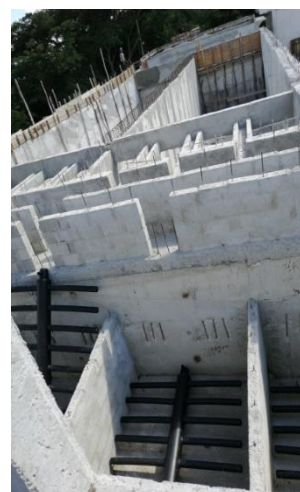
Fotografía 2: Coagulador-Floculador, Decantador y Filtros de arena Guisa