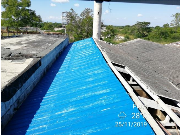
Fotografía 9: Rehabilitación cubierta depósito Jatibonico