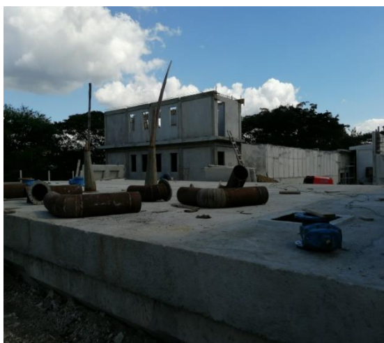
Fotografía 1: cisterna PTAP Guisa terminada