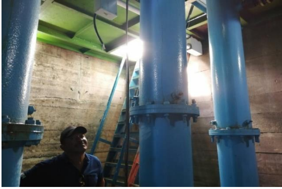
Fotografía 3: Estación Bombeo toma embalse Guisa