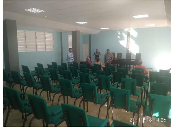
Fotografía 10: Sala de conferencia centro de formación del INRH de El Dátil