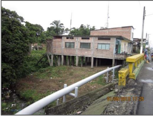
Fotografía 1: Tubería de petróleo bajo las casas