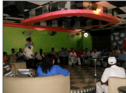
Fotografía 4: Conformación del Comité Veedor