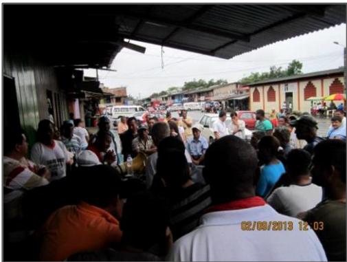
Fotografía 3: Reuniones informativa