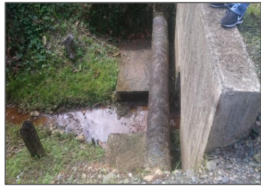
Fotografía 2: Contaminación de fuentes superficiales