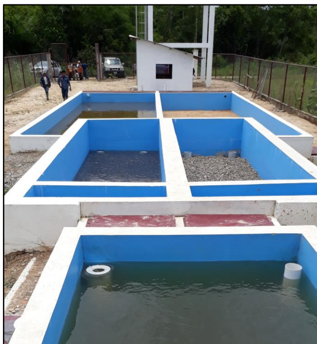
Filtros de grava y filtros lentos de arena. PTAP San Gabriel.