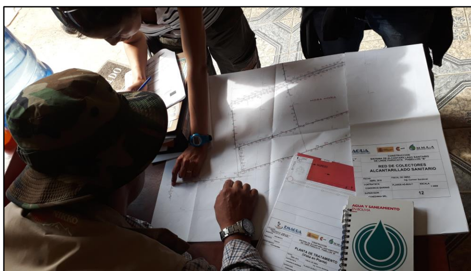
Revisión de red de colectores. AS Linde Paracaya.