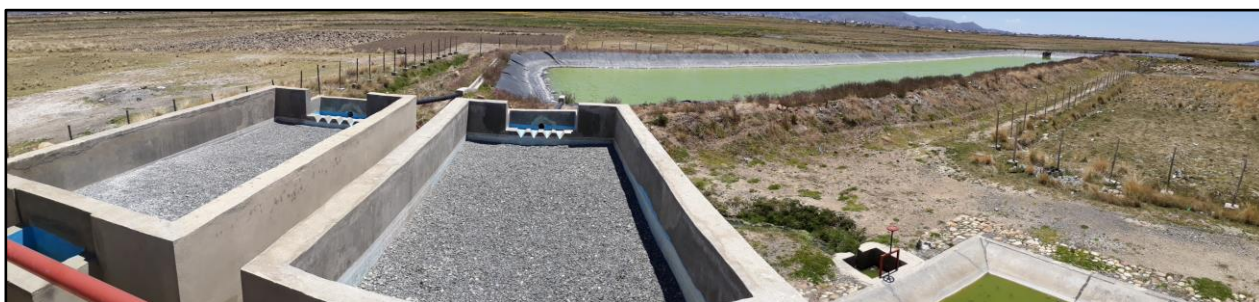
Vista general de los filtros anaerobios y laguna. AS Warisata