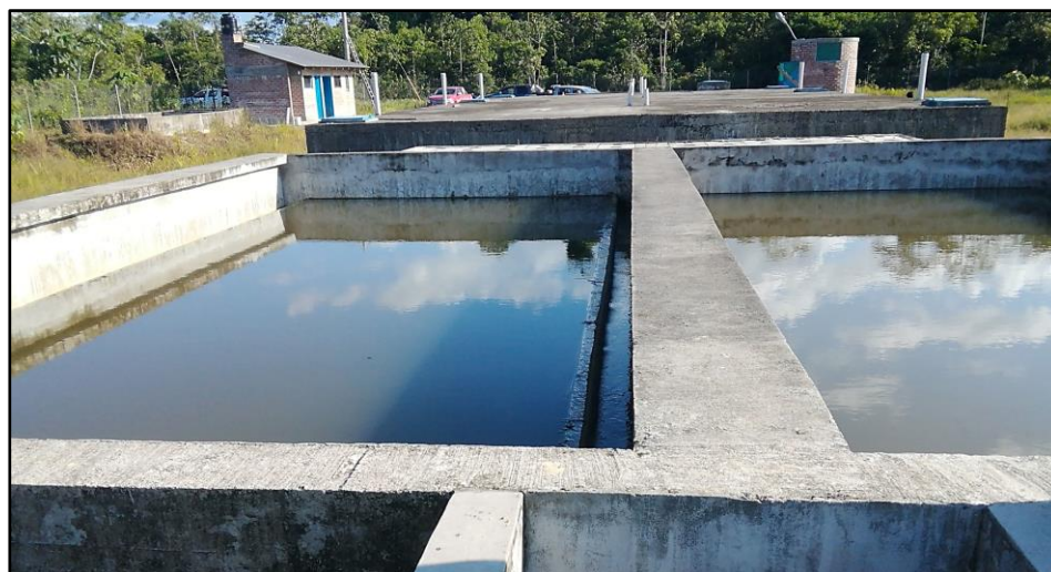
Vista general. PTAR Mariposas