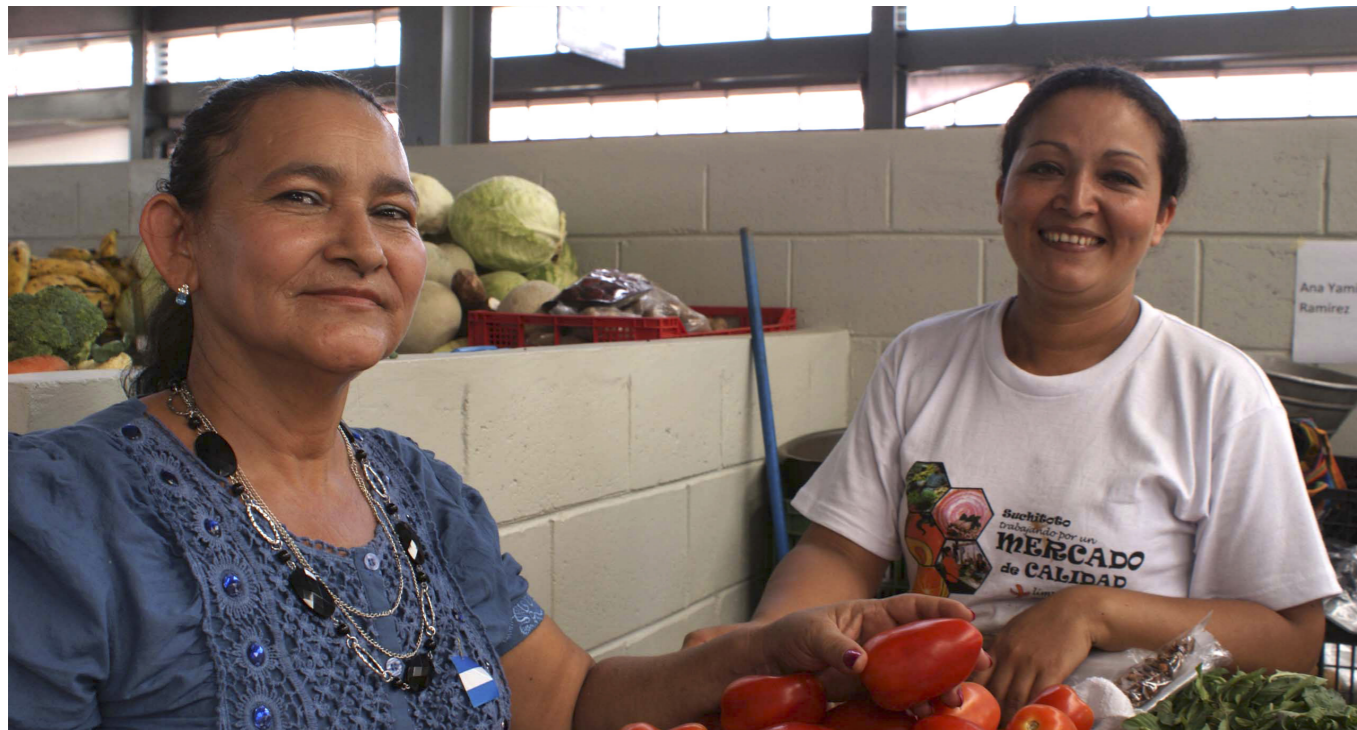
Mujeres en el Mercado salvadoreño de Suchitoto. El Salvador es uno de los países duales en el ámbito de la Cooperación Triangular en América Latina; por un lado actúa como socio oferente, y por otro como socio receptor, por ejemplo, en materia de políticas de género.

se ven afectados de forma habitual por desastres naturales que frenan e interrumpen su desarrollo y afectan a su población de forma drástica. Esta iniciativa triangular trata de fortalecer a las instituciones públicas de los países integrantes del CARICOM para mejorar su prevención y gestión ante estos desastres naturales.