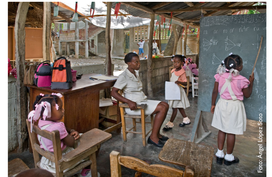
Escuela en Haití tras del terremoto. Asegurar la alimentación y la educación de los y las escolares haitianos tras el terremoto de 2010 fue uno de los objetivos de la Cooperación Española.

El programa tiene previsto, hasta 2018 trabajar para fortalecer las capacidades institucionales de los organismos responsables y actores