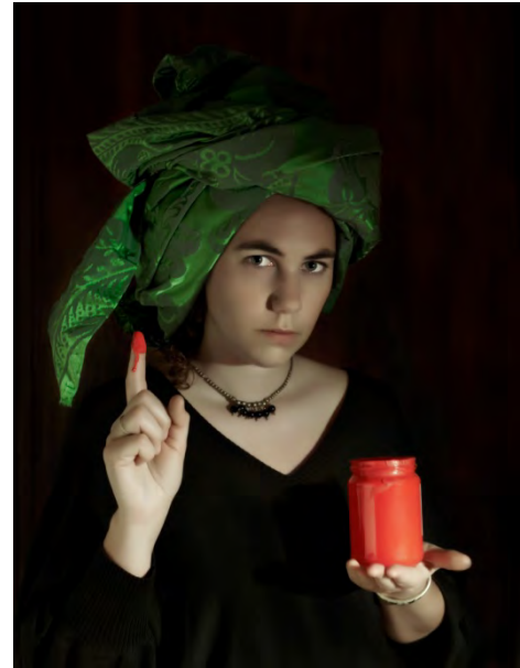
Fotografía cortesía de Paula Anta

premio internacional de artes plásticas COMBAT PRIZE. Ha recibido las becas de la Obra social y cultural de Cajastur para artistas , la de la Residencia de Estudiantes de Madrid y la del Colegio de España en París , ciudad donde también ha sido galardonada con la beca de la Cittè des arts . En la actualidad disfruta de una beca en la Real Academia de España en Roma para desarrollar un proyecto artístico. Sus obras se encuentran en colecciones como el Ministerio de Cultura, el Ayuntamiento de Madrid y en diferentes fundaciones: Fundación Masaveu, Fundación Talens, Fundación Antonio Gala. En Asturias está presente en la colección del Museo de Bellas Artes y fuera de nuestro país su trabajo puede verse en las colecciones del Centro asturiano en Méjico de Colonia Polanco y el Museo Nacional de La Habana.