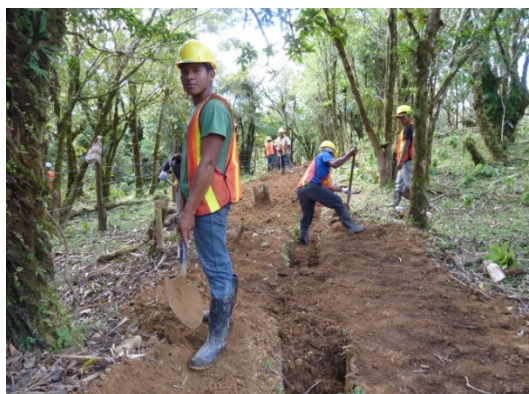
Fotografía 1: Trabajos de zanqueo y tendido de tubería en el sistema de agua de Chichica-Lijitas (LPN-02, Muná), Febrero de 2017.