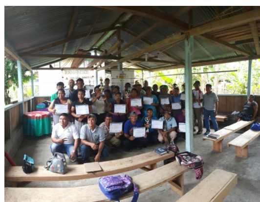
Fotografía 4: Entrega de Diplomas a personal de las JAAR capacitados en los proyectos de la LPN-01 en el distrito de Kankintú, Marzo de 2018.