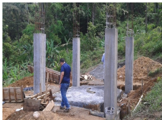
Fotografía 2: Trabajos de construcción del tanque de agua de Guayabito (LPN-01, Kankintú), Abril de 2017.