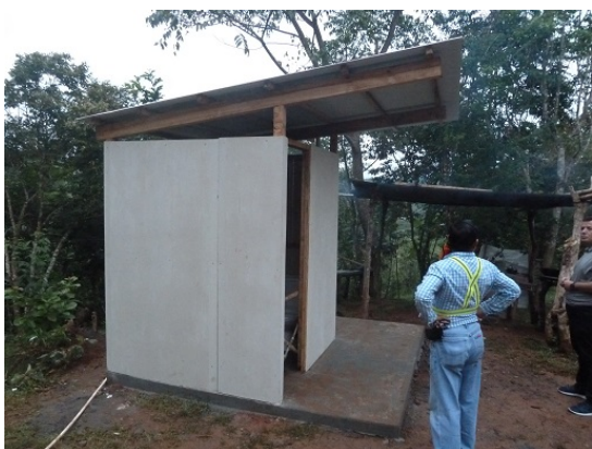
Fotografía 3: Trabajos de construcción de las unidades sanitarias básicas de Chichica-Lijitas (LPN-02, Muná), Octubre de 2017.