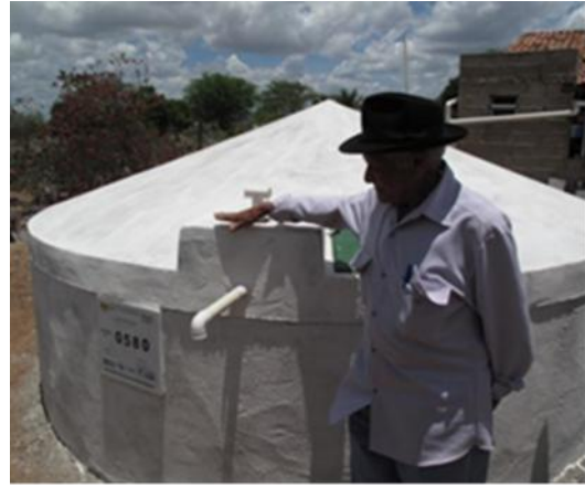
Proceso de construcción de una cisterna